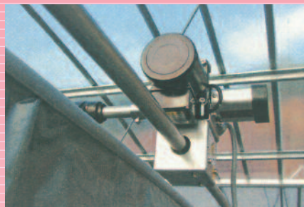
内カーテンモーター