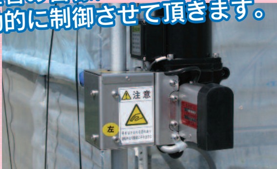
側面換気（サイド）モーター

生産者の皆様になり代わりまして温度管理及び雨天の開閉作業を自動的に制御させていただきます。