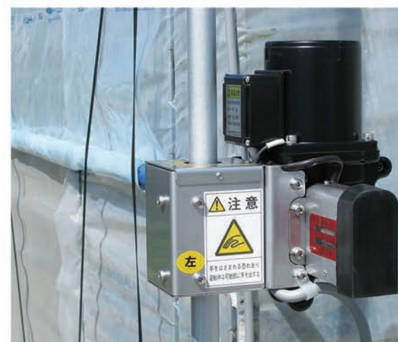
側面換気(サイド)モーター